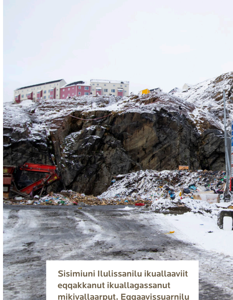
Sisimiuni Ilulissanilu ikuallaaviit eqqakkanut ikualagassanut mikivallaarput. Eqqaavissuarnilu katersorneqarlutik. Uani takuneqarsinnaavoq Sisimiuni eqqaavissuaq, oktober 2022.

Suliffissuaqarfiit sammisaat ulorianartut, pingaartumillu sammisat avatangiisinut peqqissutsimullu akornutaasinnaasut, naalagaaffiit piginnaatitsineq, pilersitsineq, sillimaniarnek aamma nakkutiginninneq inatsisiliorfigissallugit pisussaataaffigisinnaagaat Inuit pisinnaatitaaffii pillugit eqqartuussiviup ilaatigut oqaatiginikuuua. 10