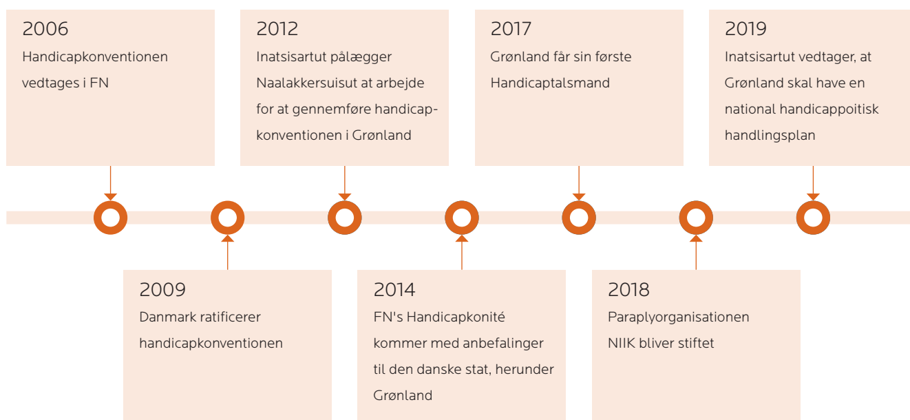
FIGUR 1: TIDSLINJE OVER CENTRALE BEGIVENHEDER I FORHOLD TIL GENNEMFØRELSEN AF FN'S HANDICAPPOLITIK I GRØNLAND

I maj 2019 vedtog Inatsisartut et beslutningsforslag om, at Grønland skal have en national handlingsplan, der skal sikre efterlevelse af FN's Handicapkonvention. Beslutningsforslaget er grundet valg til Inatsisartut bortfaldet, men det ny Naalakkersuisut har valgt at fremme initiativet. Det betyder, at Naalakkersuisut forventer at fremlægge en redegørelse for, hvordan det går med efterlevelsen af FN's Handicapkonvention, senest ved forårssamlingen 2022. Naalakkersuisut forventer på den baggrund at fremlægge en national handicappolitisk handlingsplan, der tager afsæt i redegørelsen, senest ved efterårssamlingen 2022.