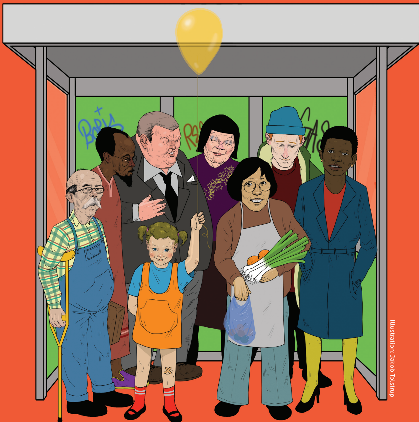
Illustration: Jakob Tolstrup